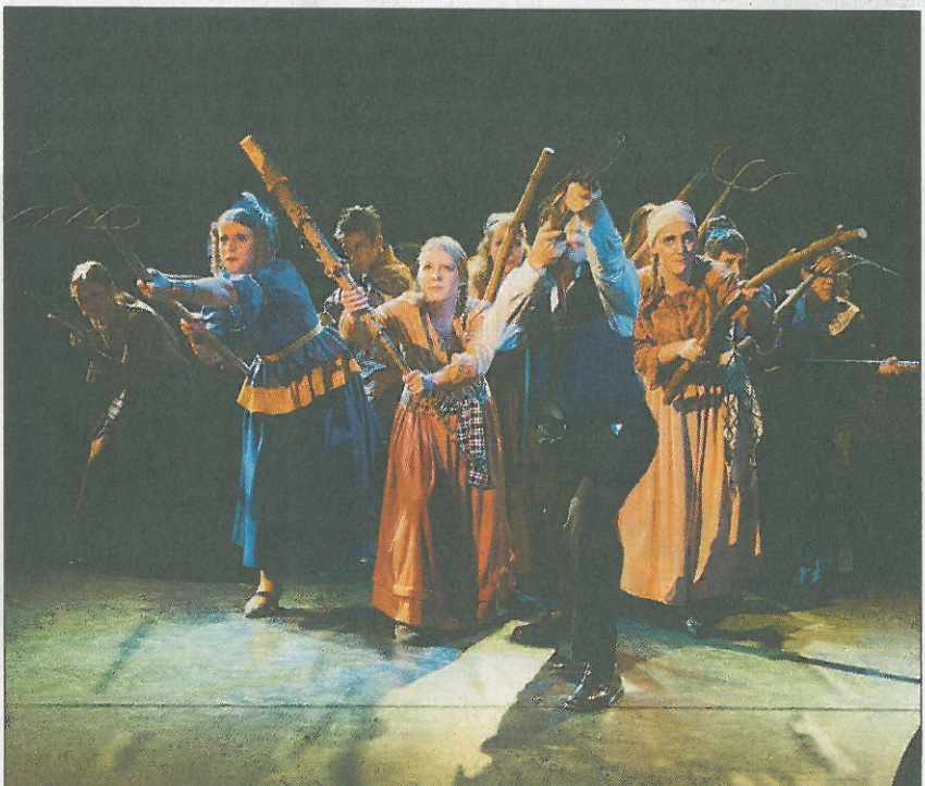
Im letzten Jahr feierte die Kantonsschule Schüpfheim mit dem Musical «Die Schöne und das Biest» einen grossen Erfolg.